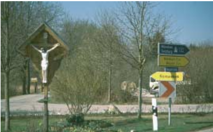
Wegkreuz an der Abzweigung

weg, der die Verbindungsstraße Großseeham-Reichersdorf erreicht. Hier biegt man links ab, wandert zunächst etwas aufwärts am Waldrand entlang, vorbei an einem Forsthaus, dann wieder bergab bis zur einer Straßengabelung, wo man sich links hält. Nun geht man entweder auf der Staumauer oder folgt der Straße und gelangt rechts zum P.